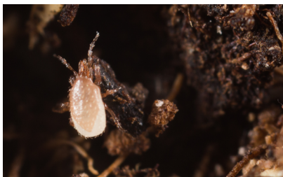
Stratiolaelaps scimitus adulto

Los estadios móviles son ácaros beige con forma de gota. Los huevos son ovalados y de color blanco transparente. Los adultos miden alrededor de 1 mm de tamaño, con un escudo dorsal marrón claramente visible, patas marrones y piezas bucales marrones.