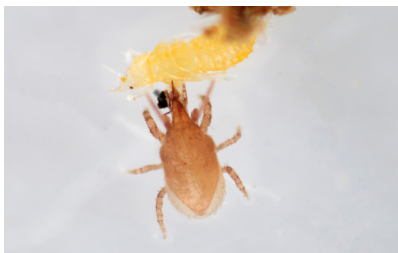
Stratiolaelaps scimitus depredando trips